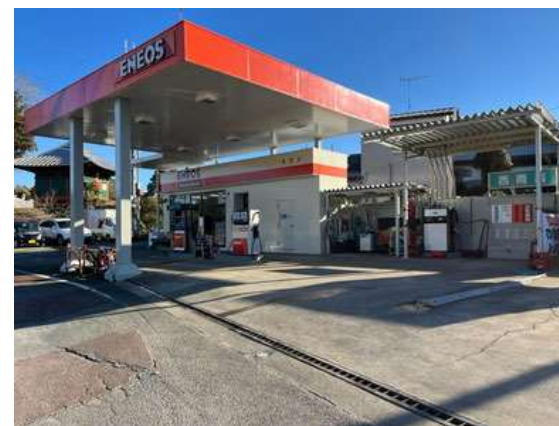
ENEOS粟源東サービスステーション （フルサービス）

営業時間：8時～19時 定休日：無し 住所：千葉県香取市高萩791 電話番号：0478-75-2455